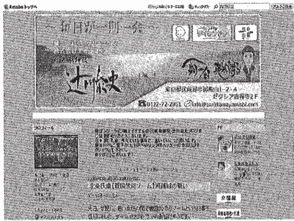
今年の9月中旬から開始したブログ「1日1回」(http://ameblo.jp/eichi-eru)。開設以来ほぼ毎日日記やコメントを更新している。