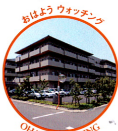
高齢者福祉施設 「岩崎あいの郷」 (愛知県小牧市)